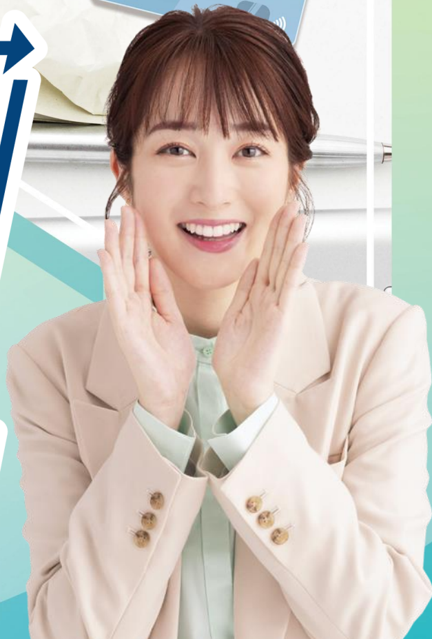
ろうきんイメージモデル 高梨臨